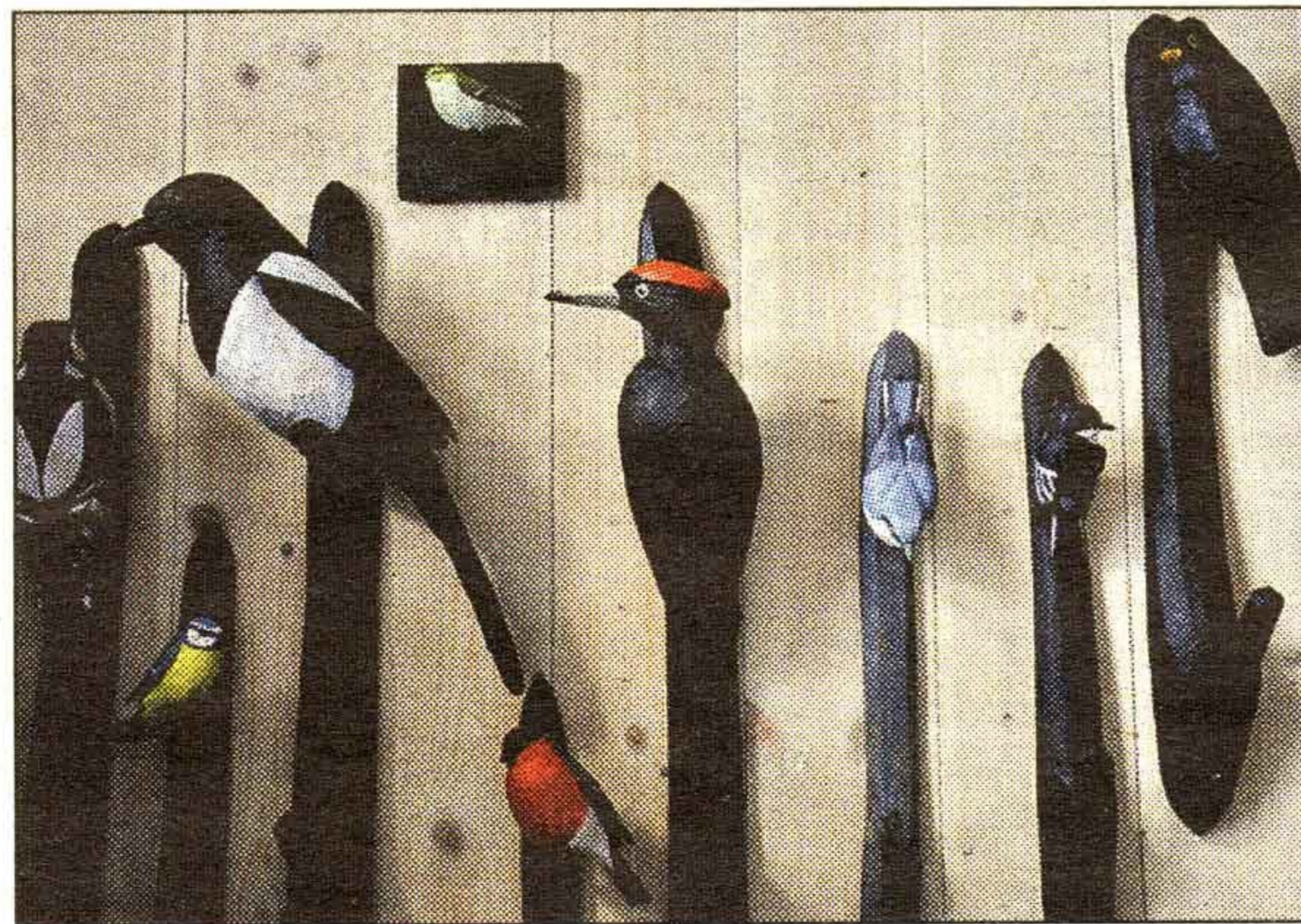
FÅGELHÄNGARE. Praktiskt att ha i sitt hem. Här kan man exempelvis hänga upp kepsen, favoritslipsen eller kikaren.