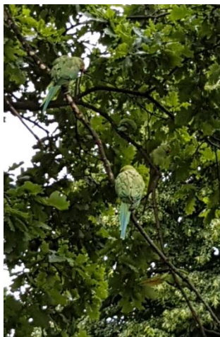
gäss duvor , parakiter och