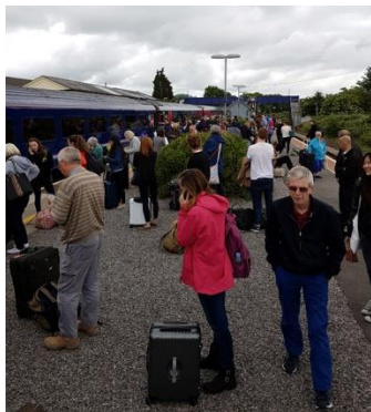
i väntan på nytt tåg

Efter ungefär 1½ timme smällde det till ordentligt och vi stannade. Det visade sig att tåget kört på ett nedfallet träd och fick till slut sakta backas tillbaka. Ingen skadad i alla fall.